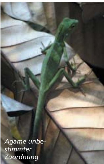
Agame unbestimmter Zuordnung

Eher tragisch war die Entdeckung einiger Hausgeckos an einem Wasserrohr. Das Rohr war komplett mit einer klebrigen Masse (ähnlich unseren Fliegenfängern) umhüllt und die Geckos klebten hoffnungslos fest. Wir haben sie vorsichtig abgelöst und versucht, ihre Haft-Lamellen unter dem Wasser-