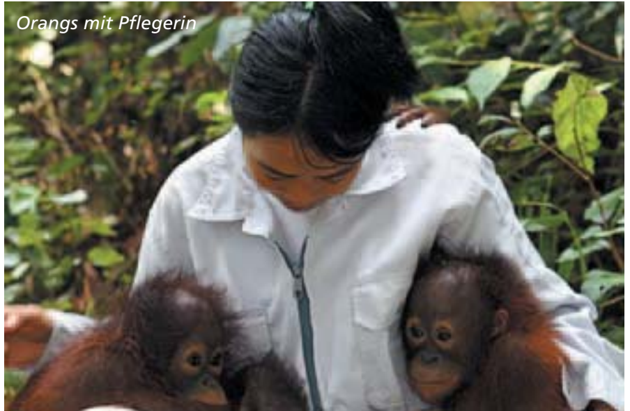
Orangs mit Pflegerin

Tuanan, einem geschützten Regenwaldgebiet, in dem wir zwei völlig wilde (aber friedliche) Orang Utans beim Fruchteverzehr in den Bäumen beobachten konnten. Ein unbeschreibliches Bild, daß ich in meinem Leben nicht mehr vergessen werde. Das Männchen saß sehr imposant nur ein paar Meter über uns und störte sich überhaupt nicht an den staunenden Menschengesichtern.